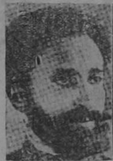
El Emperador de Etiopía HAILE SELASSIE

Según las últimas noticias recibidas el Negus y el general Badoglio, están en entendimientos para las bases de arreglo del conflicto bélico que existe entre ambos países.