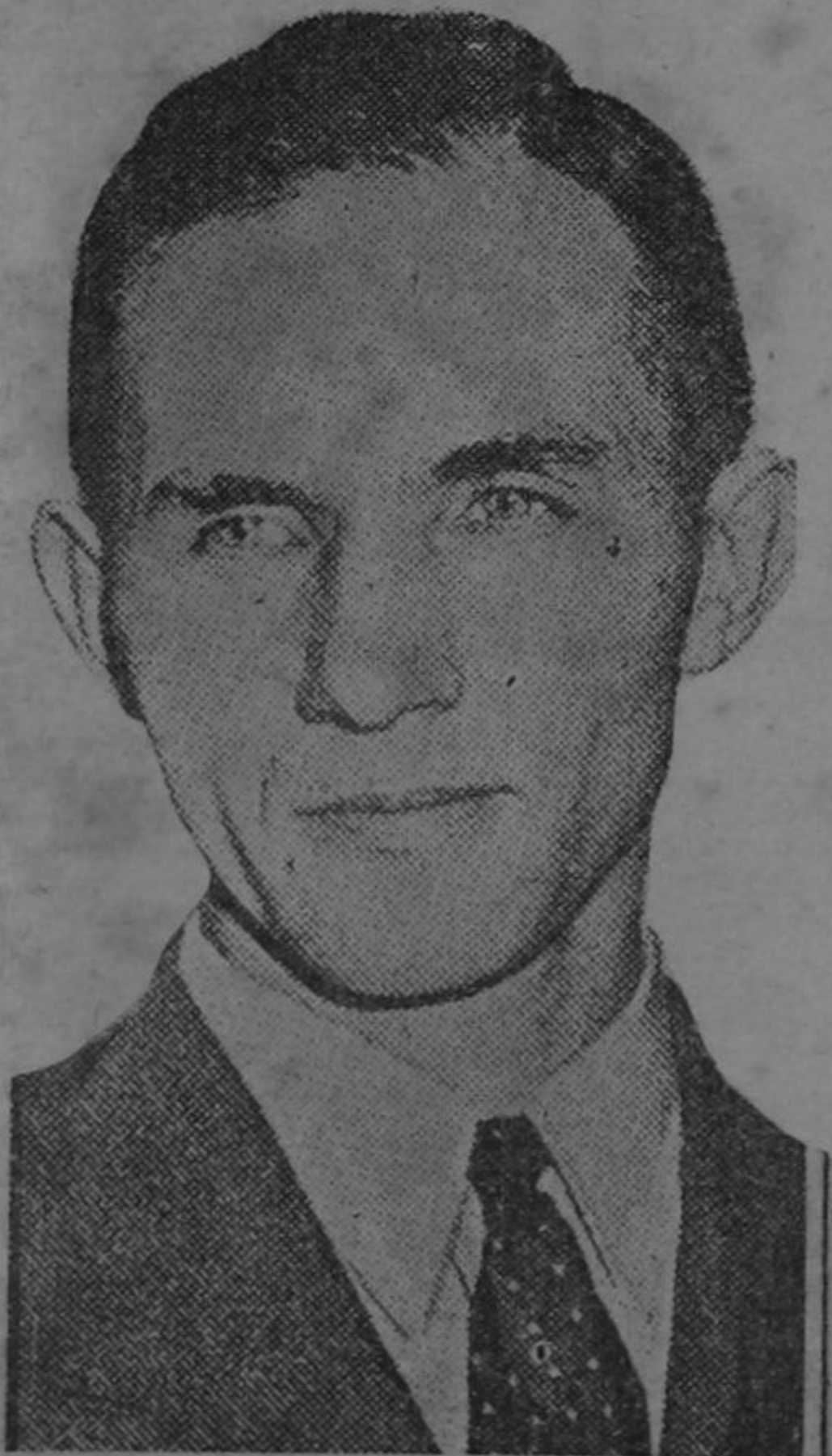
La última fotografía del tristemente célebre alemán BRUNO RICHARD HAUPTMANN

LONDRES, 2. — El gobierno británico después de su sesión de gabinete, comunicó a Francia y a Bélgica, que de acuerdo con el Pacto de Locarno, vigente, Inglaterra les prestará su apoyo, aunque fracasaren las negociaciones de arreglo con Alemania.