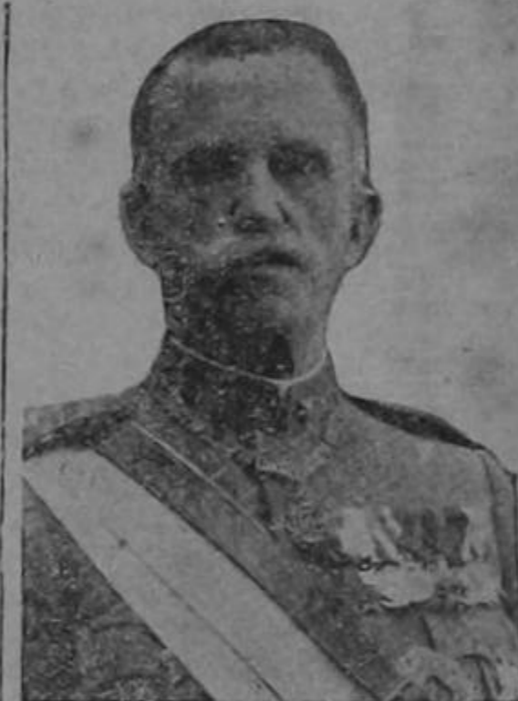
El Rey de Italia VICTOR MANUEL III

Según las últimas noticias recibidas el Negus y el general Badoglio, están en entendimientos para las bases de arreglo del conflicto bélico que existe entre ambos países.